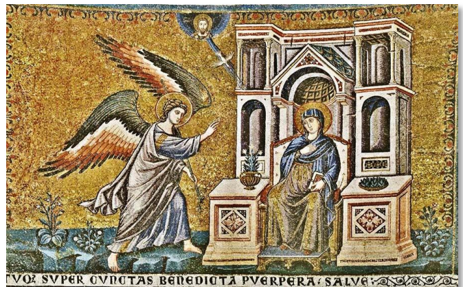
Pietro CAVALLINI (1291): Mosaico de la Anunciación (Basilica de Santa María in Trastevere, Roma)